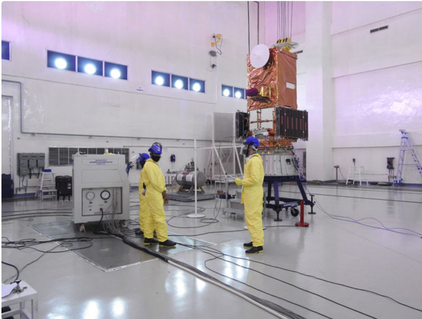
Figura 2: Amazonia 1 com o tanque carregado com hidrazina