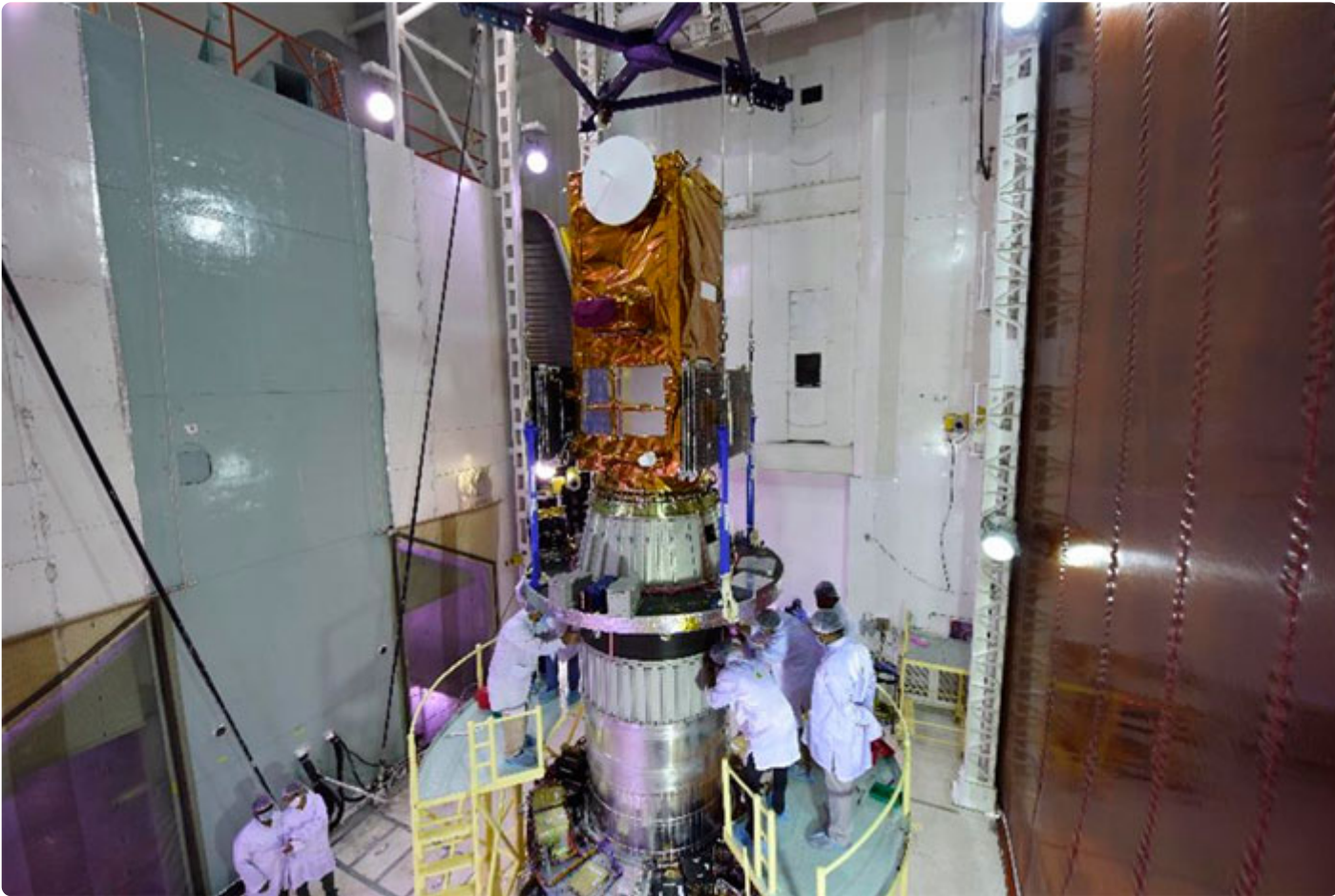
Figura 3 - Amazonia 1 sendo integrado ao PSLV