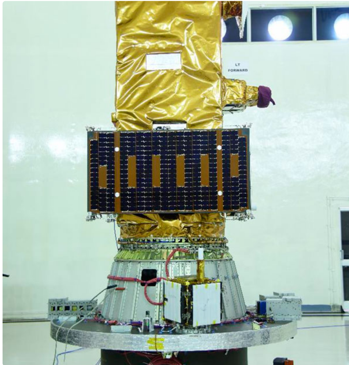
Figura 1 - Amazonia montado no MSA, juntamente com as cargas secundárias.