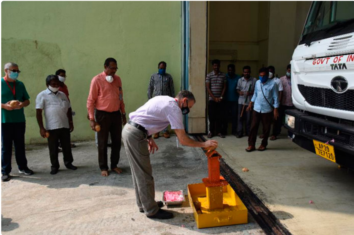
Figura 2 - Cerimonia do Coco.